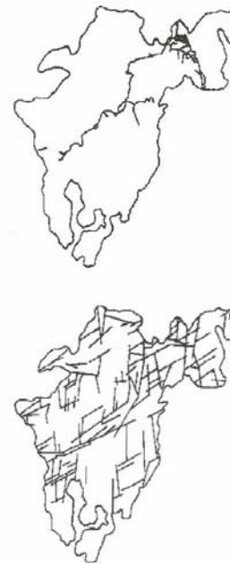
Fig. 1. Simulación del sistema cavernario Majaguas – Cantera, Pinar del Río, Cuba (arriba. Sistema real; abajo, Sistema simulado)

La cuestión mas importante en este sentido, es que el crecimiento de la entropía del sistema ocurre solamente a partir de ese instante inicial. Así, para un sistema aislado, las ecuaciones macroscópicas son