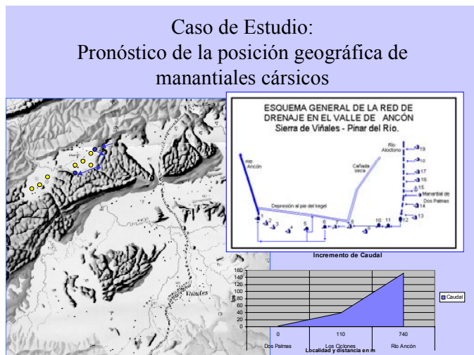
Fig. 3. Pronóstico de la posición de manantiales en Valle Ancón, Pinar del Río, Cuba.

La producción de entropía en el sistema es el elemento más importante para pronosticar la dirección en que ocurrirán los procesos de desarrollo del cavernamiento toda vez que, de acuerdo con el segundo principio de la termodinámica, ella ocurre en la dirección del máximo incremento de la entropía.